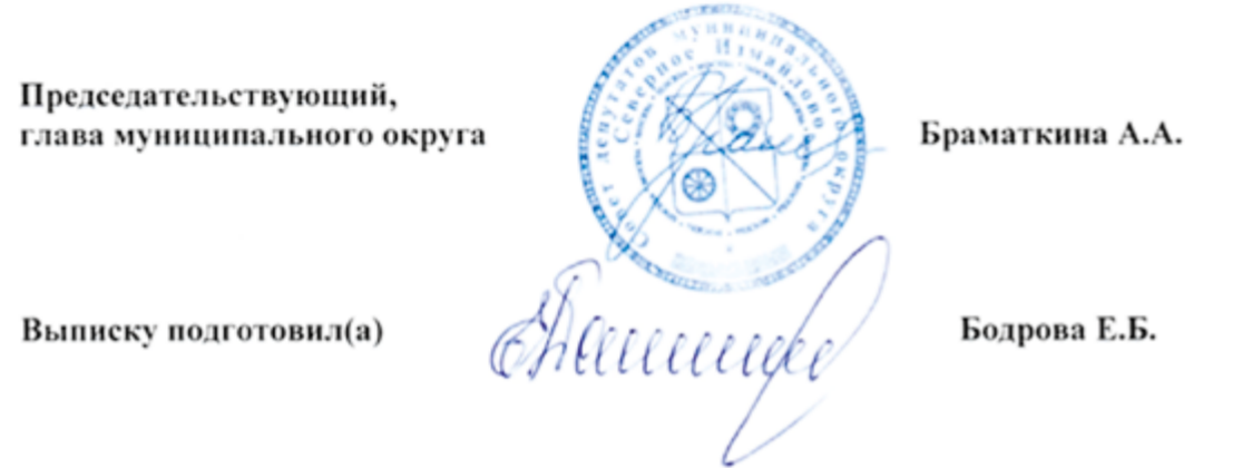
Выписка из заседания Совета депутатов с поддельными результатами голосования

Результаты голосования: принято («за» - 7, «против» - 2, «воздержалось» - 0)