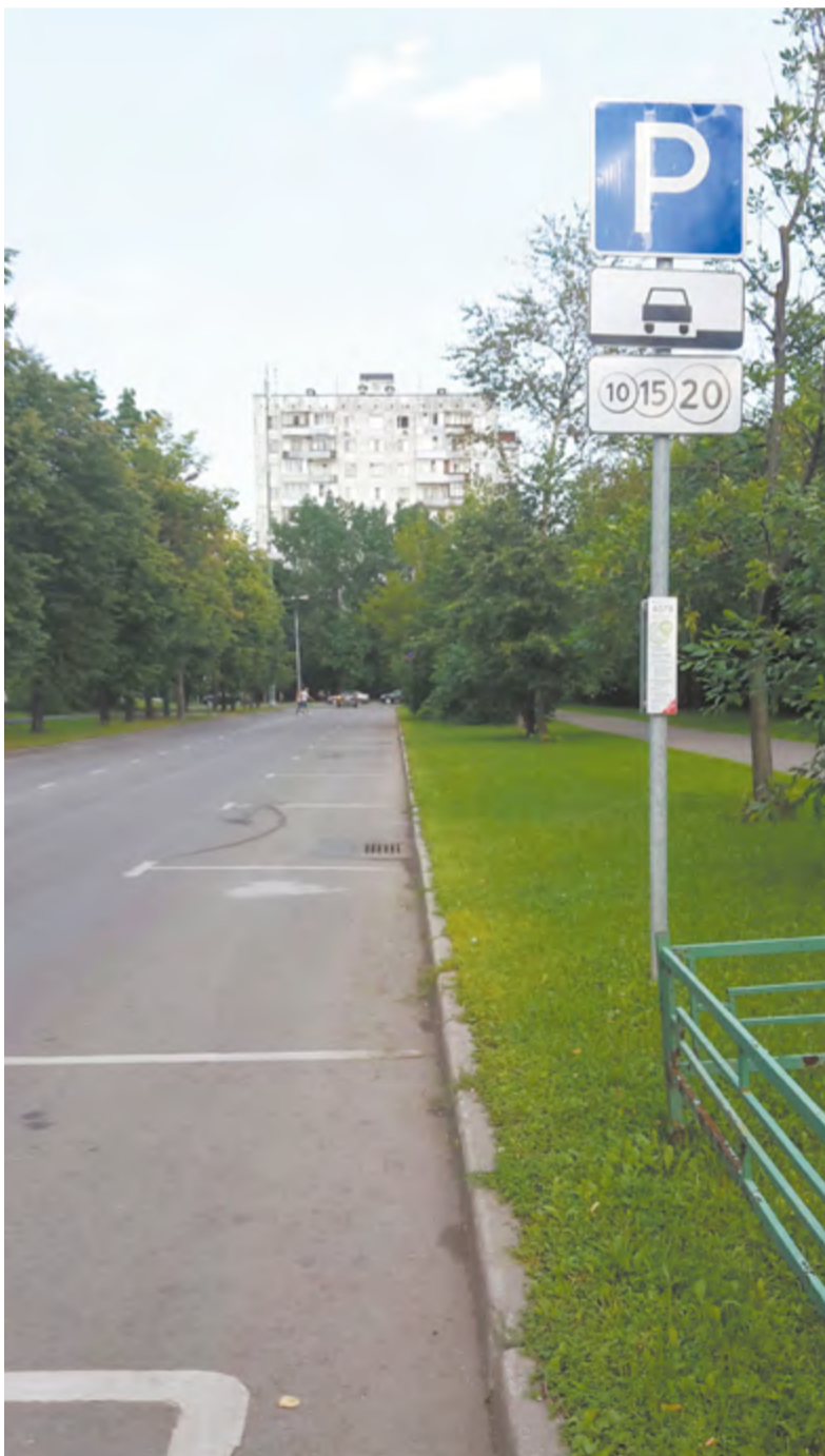
Платная парковка на ул. Константина Федина

В декабре 2016 года Департаментом транспорта, по обращению местных депутатов – членов партии «Единая Россия», был сделан своеобразный новогодний подарок жителям района – введены платные парковки на трех улицах: на улице Константина Федина, на Сиреневом бульваре от начала до 11-й Парковой ул., на 9-й Парковой улице.