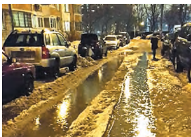
Фото отправленной жалобы по 13-й Парковой, д.40