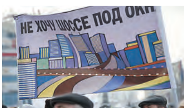
Фото с митинга 2012 года